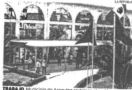
TRABAJO. Municipio de Arequipa restringe atención.

PEDIDO. Dirigente de trabajadores de comuna de Arequipa solicitó a alcalde Cándida que reduzca número de servidores.