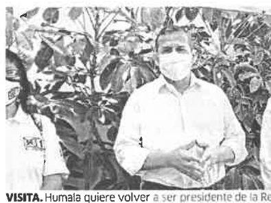
VISITA. Humala quiere volver a ser presidente de la República.

Humala propuso reactivar la economía de las familias, crear una pensión mensual de S/800