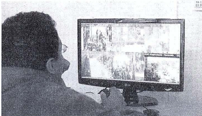
PROTECCIÓN TOTAL. Población será resguardada por igual en todos los distritos.

Ciudadana, que estaría conformado por representantes de cada unidad de serenazgo de todos los distritos involucrados. Asimismo, detalla que se subvencionará la curación de las agresiones que sufran las víctimas de la delincuencia mediante la formación del Sistema de Información de Vigilancia Epidemiológica de Seguridad Ciudadana (SIVIESE).