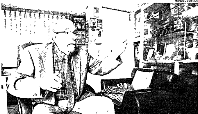
PROPUESTA. Reconocido historiador considera que técnicos deben decidir tamaño de módulo