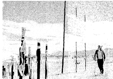
CHINCHERO. Según funcionario, obra se hará realidad si o sí.